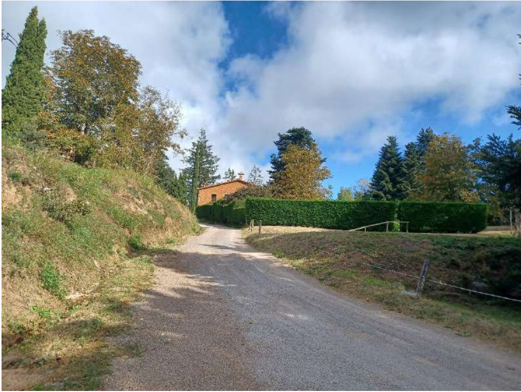
“CAMÍ DE MAS MARTÍ”